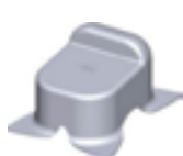
butée de sol à sceller