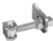
Gonds à réglage tridimensionnel