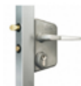
Serrure Locinox modèle barreaudé