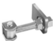
Gonds à réglage tridimensionnel