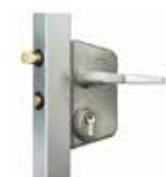
Serrure Locinox modèle barreaudé