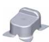
butée de sol à sceller