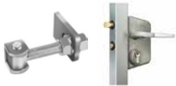
Gonds à réglage tridimensionnel Serrure Locinox modèle barreaudé